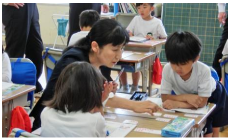
▲少人数によるきめ細やかな指導