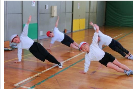
▲体育の授業における補助運動

スポーツテストの結果分析をもとに、つきたい力に合わせて補助運動を行い、力が付いてきました。