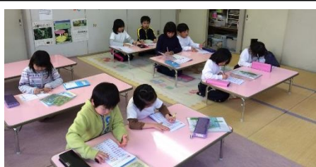
▲放課後児童クラブ

下校後、保護者のお迎えがあるまで宿題をしたり遊んだりして過ごします。上之郷保育園の敷地内にあり、園児と触れ合う活動もあります。