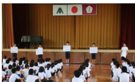
▲全校集会で発表する委員長