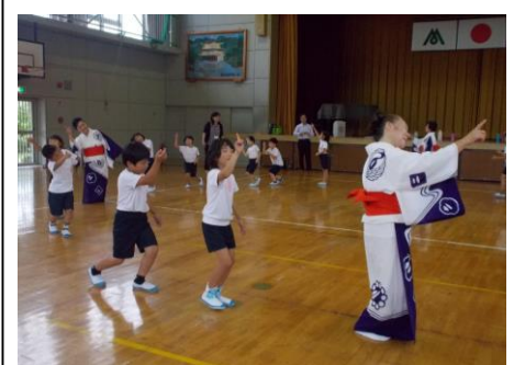
▲放課後子ども教室 盆踊り