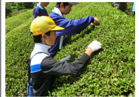
▲中学校生徒と茶摘み体験

保育園でつけた力を大切に、小学校でステップアップします。中学校の茶摘みを体験するなど、中学校の教科専門の教員が授業を行い、より専門的に学びます。