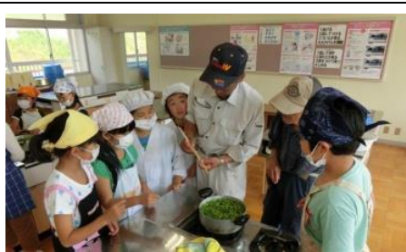
▲地域の方から学ぶ大豆学習